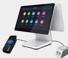
融合多种支付方式