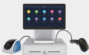
适配市场主流配件