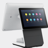
多种客显外观可选