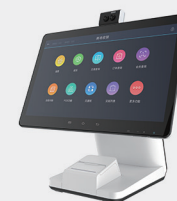
单、双目摄像头，高速热敏打印机 灵活选配，即插即用